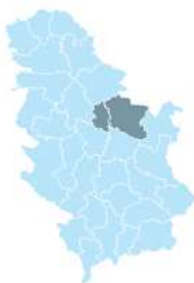
Mapa 1: Braničevsko-Podunavski region u RS