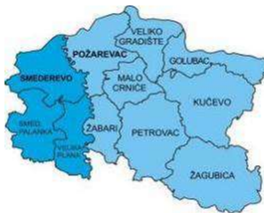
Mapa 2: Opštine Braničevsko-Podunavskog regiona