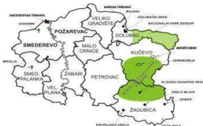
Mapa 3: Prirodni resursi regiona

Dunav, Velika Morava, Mlava i Pek, izvori vode (Krupaja, Vrelo Mlave, Ždrelo, Palanački Kiseljak i dr.), ravnice i planinski Homoljsko-Kučajski predeo, predstavljaju raznoliku i relativno netaknutu životnu sredinu. Najosetljiviji deo prirodnog nasleđa regiona – NP Đerdap je zaštićen, a ključnim prirodnim atrakcijama (Đerdapska klisura, pećine Ceremošnja i Ravništarka, Prerast, Srebrno jezero, ...) nastoji se upravljati u skladu sa principima održivog razvoja.