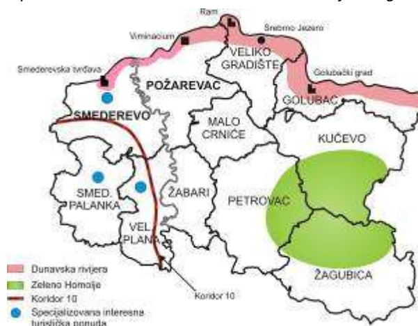
Mapa 4: Indikativne turističke brend-destinacije u regionu